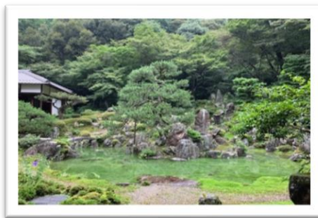
青岸寺庭園 (滋賀県米原市) : 国指定名勝 (重要文化財相当の庭園) 普段は枯山水庭園ですが、雨が多く降ると池泉庭園へと変身する二面性を併せ持つ全国でも珍しい庭園