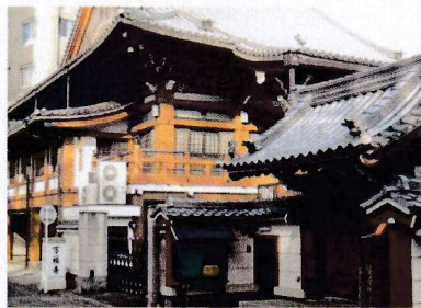
第1・2回 10月12・28日 南寺町 橋町