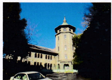
第5・6回 12月14・23日 覚王山 末森城跡